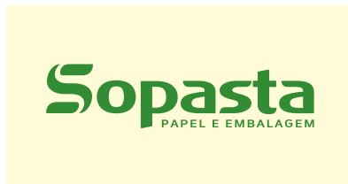
Aplicação sobre fundos claros