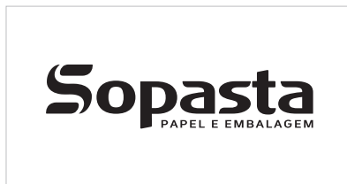
Aplicação em positivo