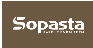
Aplicação sobre fundos escuros