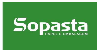
Aplicação sobre verde institucional