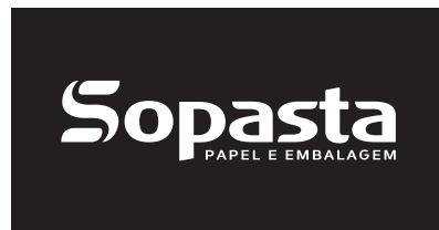
Aplicação em negativo